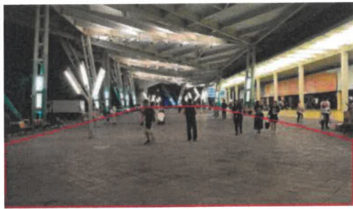
3. 長廊廣場展售區內